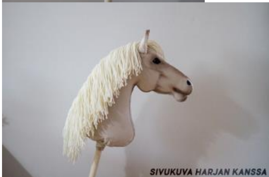
SIVUKUVA HARJAN KANSSA